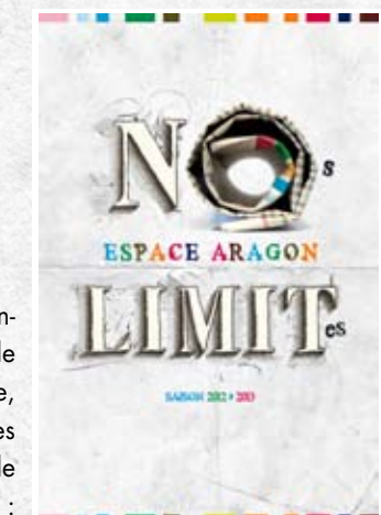
visuel de la saison www.studioespaceda.fr

Découvrez la programmation spectacles de la saison NOs LIMITEs, achetez vos places en ligne sur www.espace-aragon.net